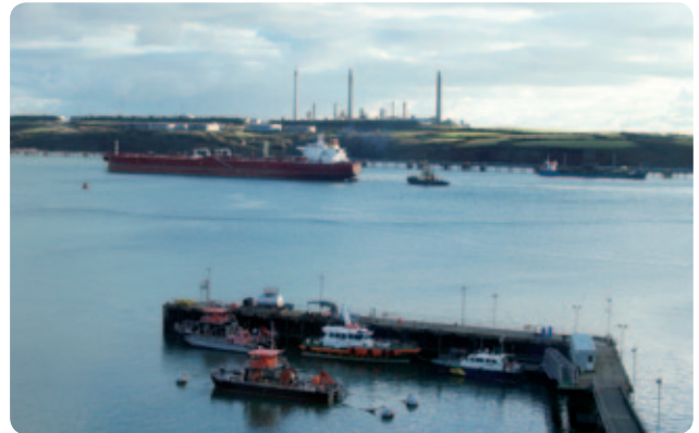
Uchod Terfynell LNG Aberdaugleddau.

Mae'r derfynell nwy hylifedig naturiol (LNG) yn South Hook, Aberdaugleddau yn gwbl weithredol bellach. Yn ogystal â chreu swyddi sgil uchel yn yr ardal, mae hefyd yn fuddsoddiad parhaus yn Sir Benfro. Cefnogwyd y prosiect gan Ystad y Goron. Mae gweithgarwch morgludiant y derfynell eleni wedi cyfateb i gyfanswm o tua 12.9 miliwn o dunelli gros; cynnydd o gymharu â ffigur y llynedd, sef 4.3 o dunelli.