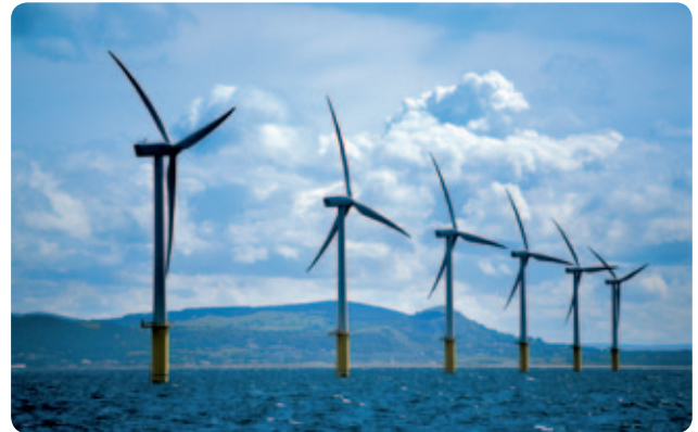
Uchod Fferm wynt North Hoyle.

Yn ystod 2010/11, gwnaethom barhau i fwrw ati â rhaglen Rownd 3 ar gyfer defnyddio ynni gwynt ar y môr. Ceir naw o barthau gwynt ar hyd arfordir y DU, y mae dau ohonynt mewn dyfroedd sy'n agos i Gymru: dyfarnwyd Parth Môr Iwerddon i Centrica Renewable Investments Ltd gyda'r parth ym Môr Hafren bellach yn nwylo Bristol Channel Zone Ltd (sy'n eiddo i RWE npower yn gyfan gwbl). Mae Ystad y Goron wedi ymrwymo i fuddsoddi dros £100 miliwn yn Rownd 3 er mwyn dileu cynifer o'r risgiau â phosibl a allai amharu ar y gwaith datblygu.