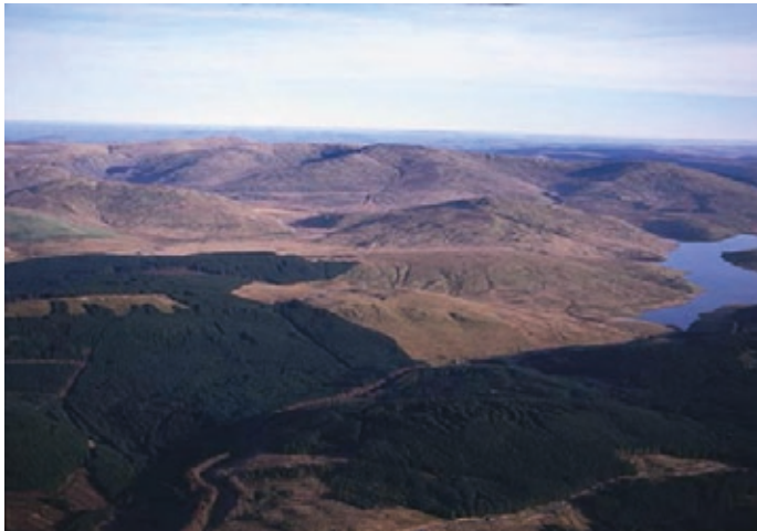
Cronfa Nant-y-moch, ym mynyddoedd y Cambrian yng nngogledd Ceredigion

Caiff ein hymagwedd at reoli asedau yng Nghymru ei lunio gan ein gwerthoedd, a'i seilio mewn gweithio partneriaeth. Rydym yn cydweithredu gydag ystod amrywiol o sefydliadau fel y gallwn gyda'n gilydd sicrhau canlyniadau cadarnhaol."