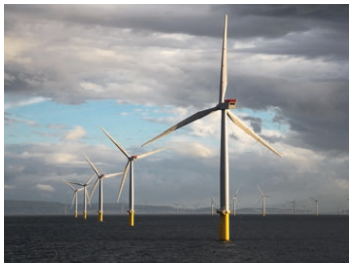
Fferm wynt Gwynt y Môr, oddi ar arfordir gogledd Cymru

Mae Ystâd y Goron yn rheoli asedau morol a gwledig ar draws Cymru. Gweithredwn fusnes pwrpasol gyda gwerthoedd cryf ac ymdeimlad clir o'r gwahaniaeth cadarnhaol y gallwn ei wneud. Mae'r adroddiad hwn yn tynnu sylw at beth o'r cynnydd a wnaethom yn 2017/18.